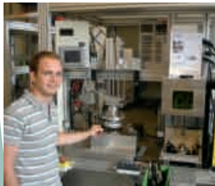
De la Mar bij een van de units

De opdrachtgever, een toonaangevend internationaal bedrijf op het gebied van de levering van turbo's voor automotoren, heeft weer een prachtige assemblage-automaat uit Nunspeet geleverd gekregen.